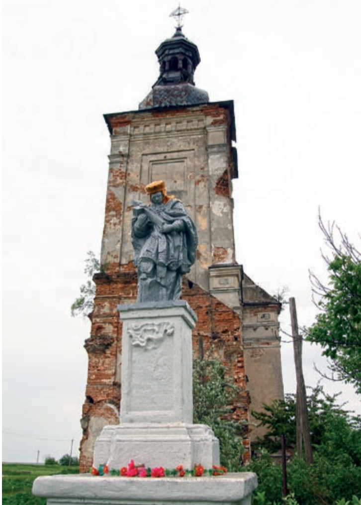
Kościół bernardyński w Lesznowicy