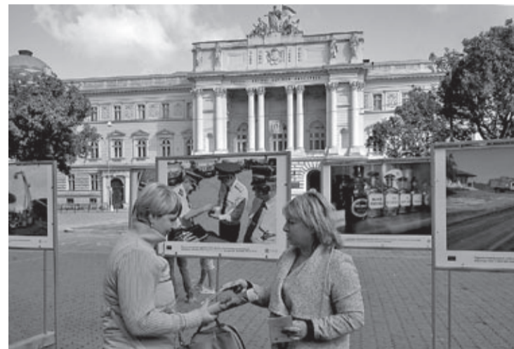
Wystawa na placu przed Uniwersytetem Lwowskim im. Iwana Franki

Z okazji Dnia Europejskiej Współpracy 2016 na Ukrainie 14-25 września Oddział WST Programu Polska-Białoruś-Ukraina 2007–2013 we Lwowie zorganizował wystawy fotograficzne w sześciu miastach obwodowych, znajdujących się na obszarze Programu na Ukrainie: w Łucku, Równem, Tarnopolu, Iwano-Frankowsku, Użhorodzie i we Lwowie.