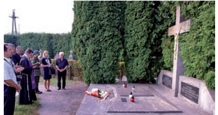
Wspólna modlitwa na cmentarzu w Malechowie

nizowanych przez fundację Wolność i Demokracja oraz prowadzonych dzięki wsparciu Konsulatu Generalnego RP we Lwowie przez ukraińską organizację „Pamięć”, zostało złożonych na cmentarzu polskim w Mościskach. Chociaż pierwotnie według zamysłu osób zainteresowanych taką wojskową nekropolią 1939 roku miał być cmentarz w Malechowie. Niestety nie udało się tej kwestii uzgodnić z lokalnymi władzami. Do