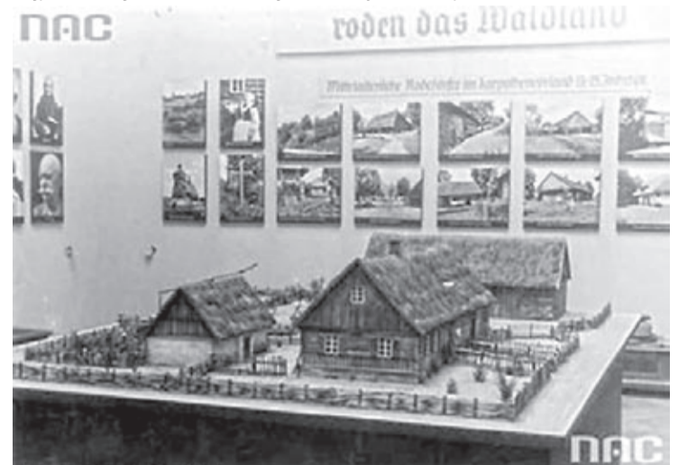
Fragment wystawy „Niemiecka działalność w obszarze Wisły”. Widoczna makieta zagrody chłopskiej

Sprawę omawiano z min. Beckiem, kiedy ten, nie doczekawszy się na Riwerze zaproszenia ze strony francuskiego ministra spraw zagranicznych, w drodze powrotnej zatrzymał się w Berchtesgaden. Beck przyjął wówczas do wiadomości sugestie niemieckie, uznając, że sprawa ta winna być rozwiązana, powoływał się jednak na trudności ze strony polskiej opinii publicznej. Kwestia ta była także przedmiotem rozmów za