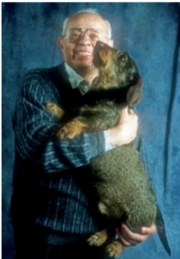
Stanisław Lem, 1993 r.

13–18 września br. w ramach 23. Forum Wydawców we Lwowie odbył się festiwal „Miasto Lema”, którym uświetniona została 95. rocznica urodzin Stanisława Lema.