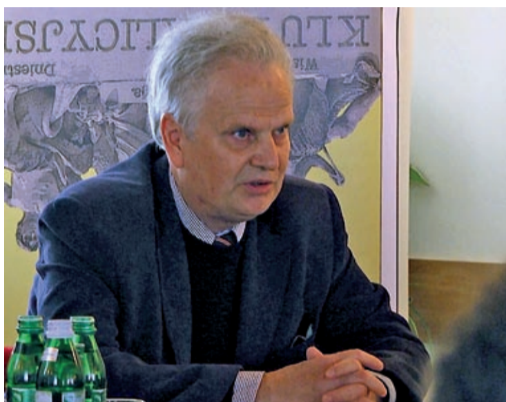
Brytyjczycy zdecydowali się na brexit.

W chwili obecnej nie ma dobrych warunków, atmosfery, by mówić o szybkim członkostwie Ukrainy w Unii Europejskiej. Nie oznacza to jednak, że należy zrezygnować z tych starań. Członkostwo Ukrainy w Unii Europejskiej powinno być długofalowym, strategicznym celem. Muszą jednocześnie zmienić się okoliczności w Unii Europejskiej, aby ona była gotowa kiedyś Ukrainę przyjąć.