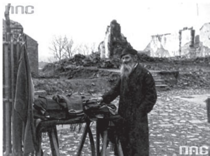
Uliczna sprzedaż ubrań przez starego Żyda wśród ruin

Co słyhać w kraju w walce o bezpieczeństwo życia. (WARSZAWA) W okręgu warszawskim rozpoczęła się pierwsza tegoroczna kontrola wszelkich pojazdów mechanicznych. 300 kontrolerów sprawuje pieczę nad ruchem w Warszawie i na ważniejszych drogach 10 powiatów. Wszystkie przejeżdżające samochody zarówno prywatne jak i urzędowe są zatrzymywane dla sprawdzenia kwalifikacji zawodowych szoferów i stanu użytkowego wozów. Wozy posiadające defekty techniczne, są skierowywane na „punkt technicznego badania”, gdzie przez specjalną komisję i braki są uzupełniane. Że kontrola ta była bardzo potrzebna, świadczyć może najlepiej fakt, że już w pierwszym jej dniu „zdyskwalifikowano” w samej Warszawie kilkaset wozów niebezpiecznych dla ruchu, oddając je do gruntownego remontu lub na szmelc. Po zakończeniu kontroli niewątpliwie w szybkim czasie zmniejszy się znacznie ilość przejechań i innych nieszczęśliwych wypadków,