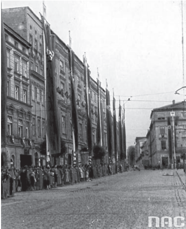
Udekorowany flagami III Rzeszy Rynek Główny w Krakowie (wówczas plac Adolfa Hitlera)

HIPERKONSTRUKCJA. Dokoła czołgu zebrał się strzelec górski, rozprawiając z ożywieniem. W ciągu tygodnia zapoznali się już ze sposobem walki bolszewików, z ich taktyką masowego rzucania w ogień ludzi, z ich brutalnością, tępotą i uporem, który kazał im strzelać jeszcze z