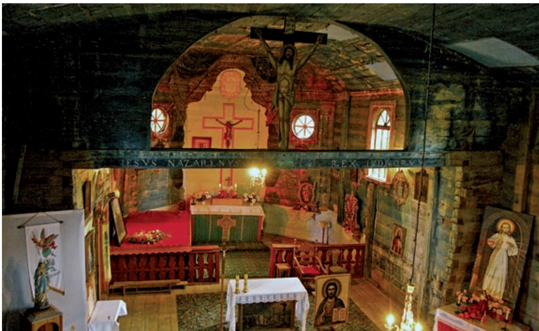
Wnętrze kościoła w Tadaniach

Od prawej do kościoła przytykał klasztor, ślady którego są jeszcze dobrze widoczne. Przed kościołem znajduje się figura św. Jana Nepomucena, której niedawno przywrócono głowę, a z tyłu świątyni – obelisk w kształcie piramidy.