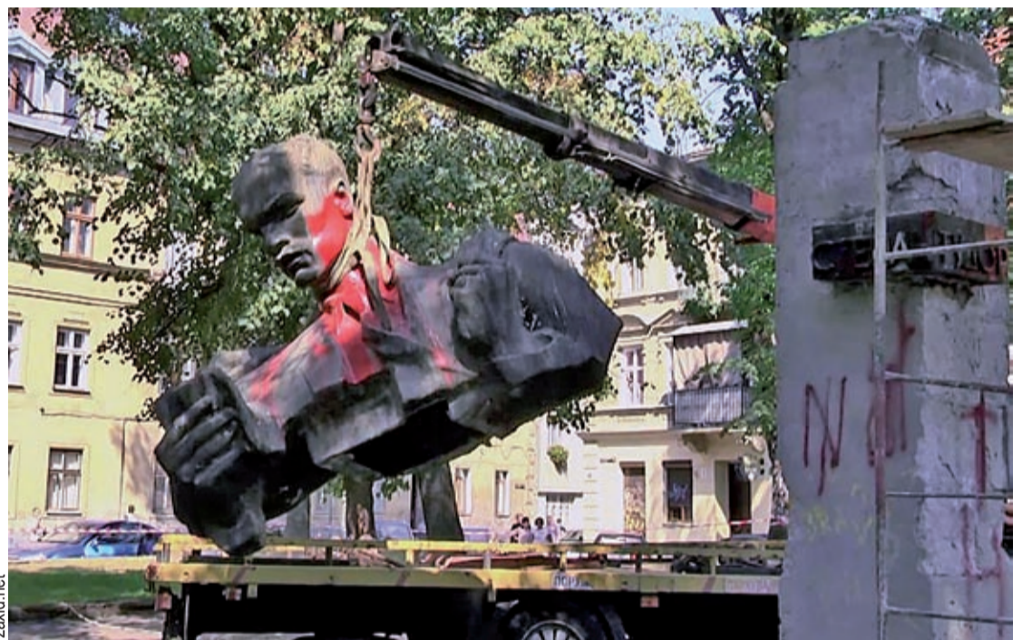
Demontaż pomnika Stepana Tudora we Lwowie

W na wskroś zdekomunizowanym obwodzie lwowskim nie znaleziono niczego lepszego jak zmienić nazwę wioski Andrijówka (niby na-