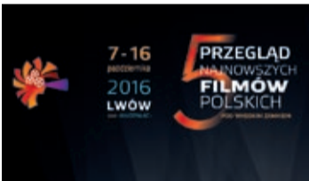
Przegląd po raz piąty! s. 15–18