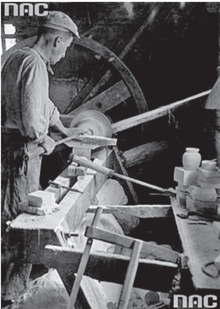
Robotnik podczas szlifowania w wytwórni wyrobów z alabastru w okolicach Stanisławowa

zamieszkania. Przy zapisach należy okazać metrykę chrztu, świadectwo szczepienia ospy, ostatnie świadectwo szkolne, oraz paszport lub inny dokument stwierdzający tożsamość rodziców wzgl. opiekunów.