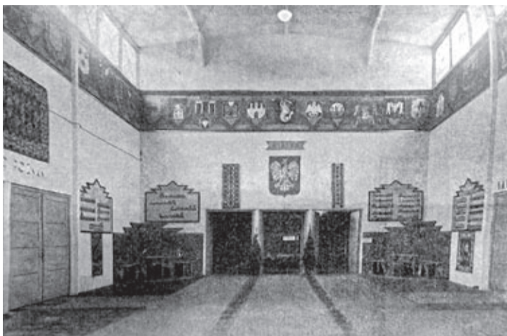
Hall pawilonu samorządowego Związku Miast Polskich na PWK