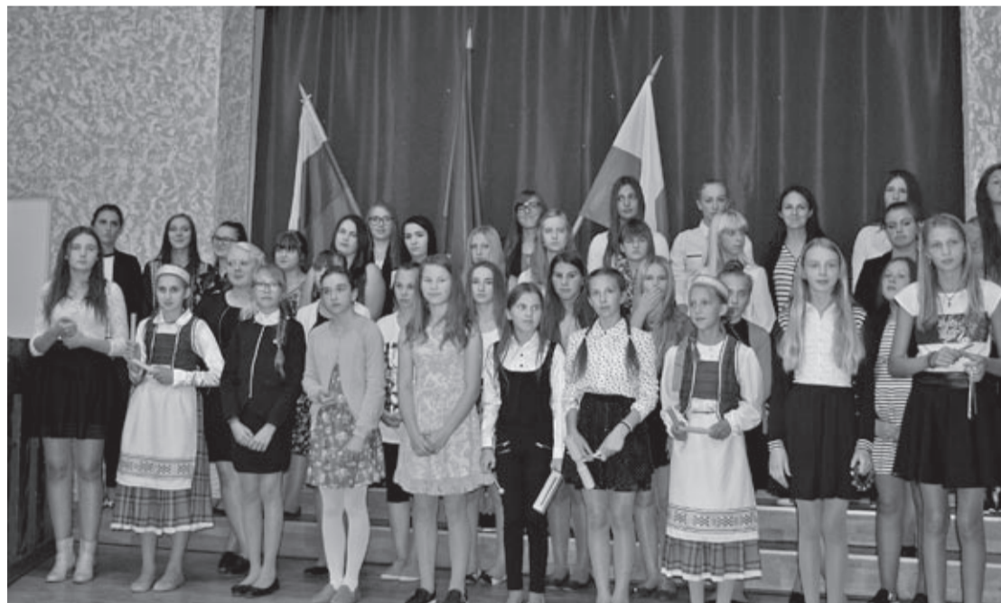
Występ artystyczny młodzieży litewskiej

Po mszy św. nastąpiła uroczystość odsłonięcia i poświęcenia tablicy pamiątkowej w języku litewskim i polskim na fasadzie kościoła upamiętniającej Henryka Sienkiewicza. W akcie erekcyjnym tablicy czytamy: Piewcy dzieł Laudy, Henrykowi Sienkiewiczowi, Pisarzowi Noblisty, w setną rocznicę śmierci – Litwini i Polacy. Wodokty 2016.