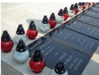
96. rocznica bitwy pod Dytiatynem Konstanty Czawaga s. 4