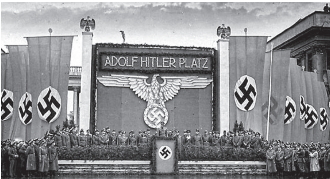
Uroczystości w Warszawie z okazji kolejnej rocznicy wybuchu II wojny światowej

Wczorajszy dzień budził przykre i bolesne wspomnienia. Poranek 1