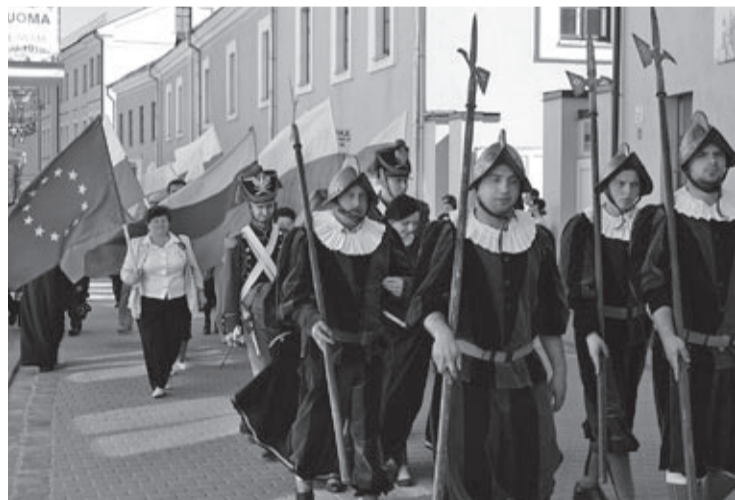
Festyn w Kiejdanach

Wśród szerokich pól, mimo że znacznie rzadziej niż przed kilkoma stuleciami znaczone lasami, znajdziemy i dziś te same co niegdyś „sienkiewiczowskie” miejscowości: Kiejdany, Ponie-