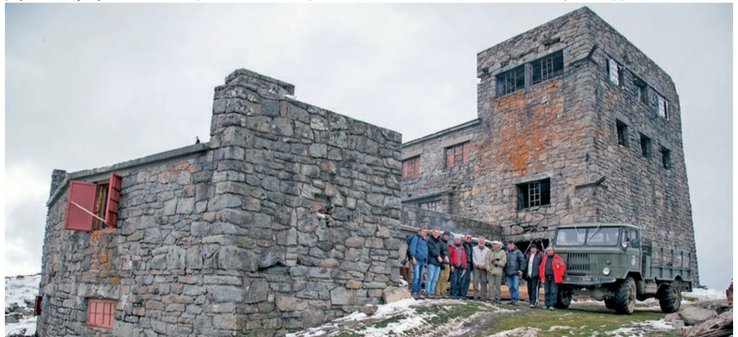
Uczestnicy konferencji przed obserwatorium astronomicznym na górze Pop Iwan