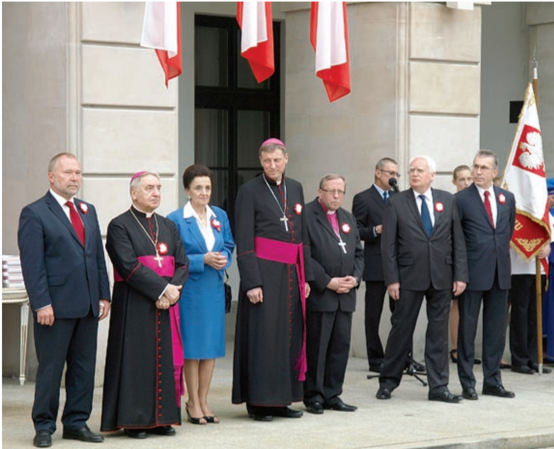
Przed Pałacem Prezydenckim