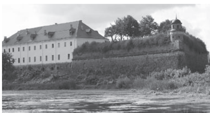
Zamek w Dubnie

Aby zaskarbić sobie wsparcie europosła zamek w Dubnie odpowiednio przygotowano. Z Lwowskiej Galerii Obrazów wypożyczono ekspozycję malarstwa. Dodatkowo otwarto ekspozycję z własnych magazynów. Przedstawiono zbiory numizmatów, bonistyki, falerystyki i heraldyki pod nazwą „Karbowana historia”. Efekt został osiągnięty –