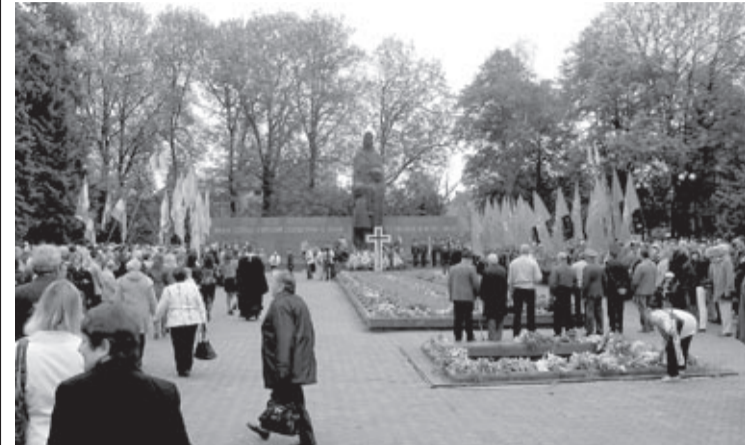
Przy pomniku żołnierzy poległych w II wojnie światowej

9 maja na Skwerze Memorialnym przy ul. Bohdana Lepkoho w Iwano-Frankowsku odbyły się oficjalne obchody Dnia Zwycięstwa.