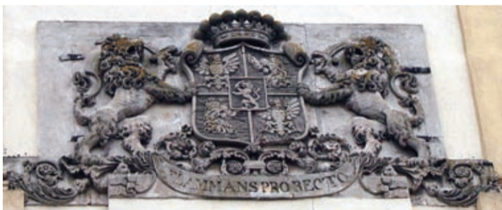
Herb rodu Lanckorońskich