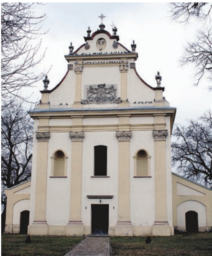
Kościół w Jagielnicy

Do zamku ze wsi kawalek drogi. Idąc asfaltową drogą i oglądając zabudowania mieszkańców Jagielnicy – zarówno te murowane, jak i te opusz-