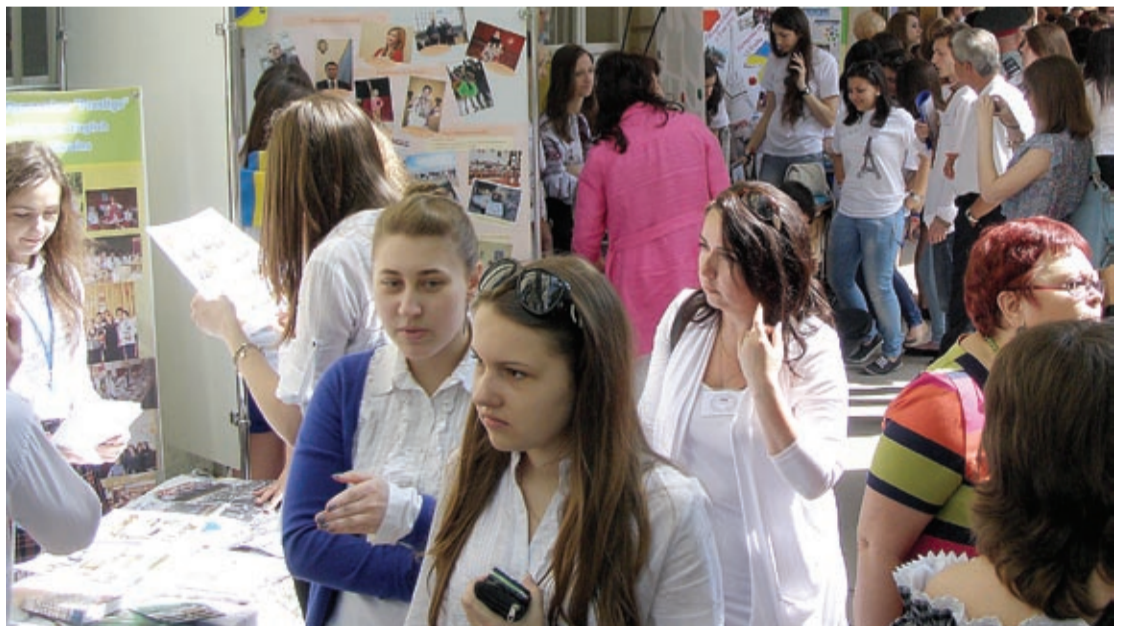
Pod ratuszem gwarno i kolorowo

Zdarzają się na tym maratonie i scenki zabawne. Przeważnie o szkole przechodniom opowiadają uczniowie starszych klas, pokazują plansze, przedstawiają walory ich szkoły. Na stoisku szkoły nr 4 z językiem angielskim stanęła para uczniów z młodszej klasy – chyba 3 lub 4. Była to chyba para taneczna, bo ubrani byli w stroje do tańca. Ale opowiadali z taką ekspresją, takim zaangażowaniem i tak barwnie, że