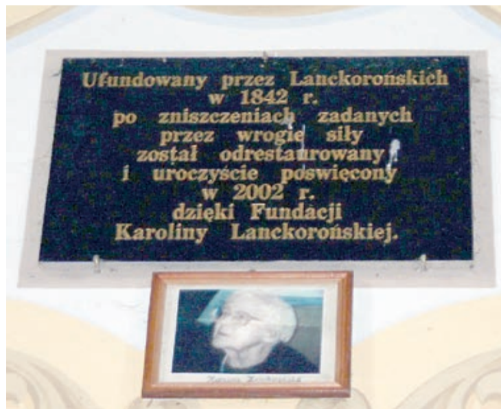
Tablica pamiątkowa, poświęcona hr. Karolinie Lanckorońskiej

Za czasów niepodległej Ukrainy zakład sprywatyzowano i zaczął on podupadać, aż całkowicie splajtował. W roku 2000 zamek wykupił rosyjski biznesmen Aleksander Potiomkin, ale z czasem i on sprzedał posiadłość. Wziął 950 tys. dolarów. Znaleźli się kupcy z województwa czerkaskiego i teraz oni są właścicielami 14 216 m kw. powierzchni użytkowej i 4,4 ha terenów wokół zamku. Jednak około 400 m kw. należy do rosyjsko-ukraińskiej spółki „Global-Kosmetik”. Położenie przy trasach ma Kamieniec