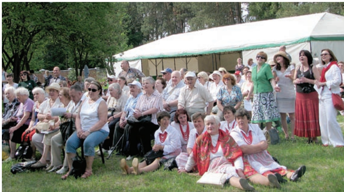
Bawimy się na całego