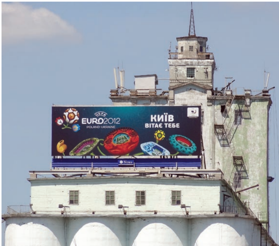
Kijów wita kibiców

Kiedy nałożymy na siebie te dwa obrazy powstanie nam dość klarowna diagnoza współczesnej sytuacji politycznej w tej części Europy. Bo w to, że Rosja jest demokratyczna, praworządna i nikt tam nikogo nie przesładuje nawet dziecko nie uwierzy. Ale też i nie uwierzy w to, że gdyby Ukraina była potentatem w wydobywaniu i handlu surowcami energetycznymi, a także chłonny rynkiem zbytu, to ktokolwiek przejąłby się losem Tymoszenko. No, może poza kilkoma