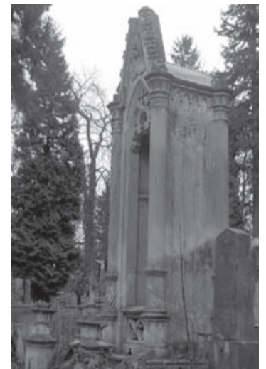
Grobowiec rodziny Chołoniewskich