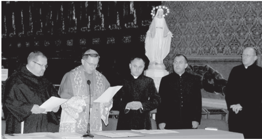
Arcybiskup Mieczysław Mokrzycki ogłosił dekret o rozpoczęciu procesu beatyfikacyjnego

4 maja, we lwowskiej katedrze łacińskiej, w 100. rocznicę urodzin o. bpa Rafała Kiernickiego, długoletniego proboszcza tej świątyni, rozpoczęto jego proces beatyfikacyjny. Uroczystej sesji i Mszy św. z udziałem duchowieństwa dwóch obrządków – łacińskiego i bizantyjskiego przewodniczył arcybiskup Mieczysław Mokrzycki, metropolita lwowski.