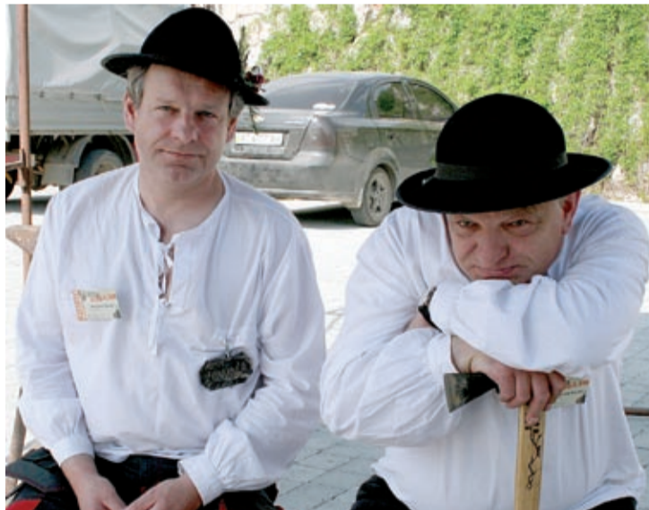
Kowale z Limanowej

W białych górskich strojach, czarnych kapeluszach, z ciupagami w rękach zwracają na siebie uwagę polscy kowale z Limanowej. Już po raz drugi odwiedza Stanisławów