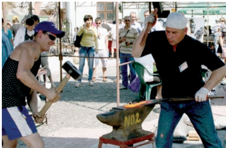
Tak rozpoczyna się festiwal kowalski

niądze. Może władze miasta o tym pomyślały” – mówią, mrugając kowale z Finlandii.