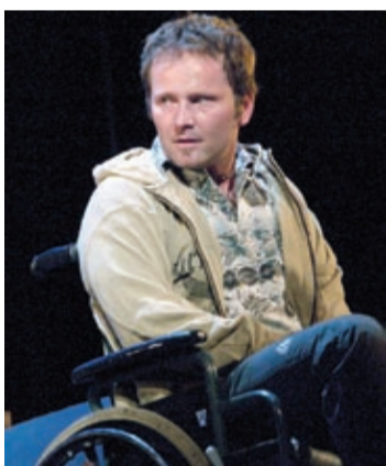
Odtwórca głównej roli

optyzm. Nie znosi litości, broni swojej godności i walczy o miłość, buntuje się i nie zgadza się na cierpienie.