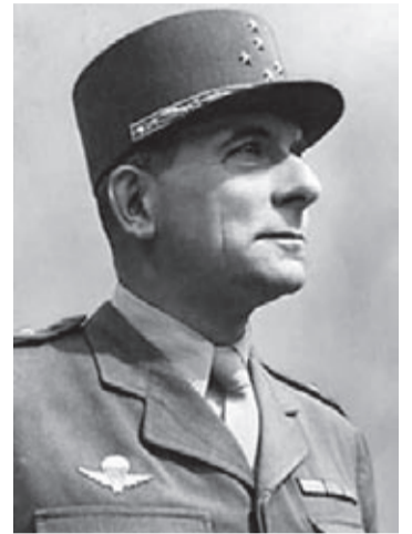
Generał de Lattre de Tassigny. Człowiek, który uczynił Francję mocarstwem

Dziarsko ruszyły przygotowania, bo czas naglił. Tym razem to Związek Radziecki grał rolę gospodarza. W dzielnicy Berlina Karlshorst znaleziono niezniszczone kasyno oficerskie szkoły saperów, gdzie postanowiono urządzić uroczystość. Na lotnisku