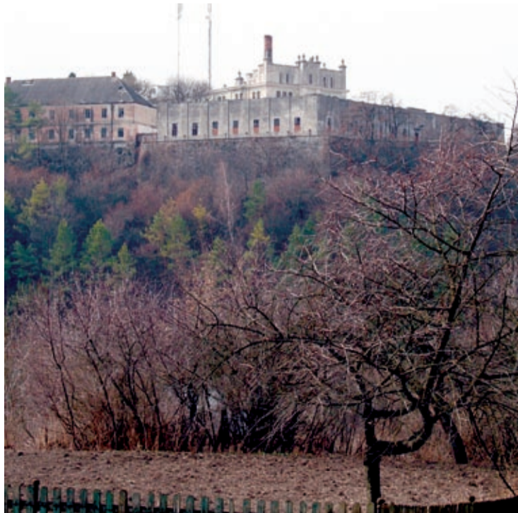
Widok na zamek w Nagoriance

Olbrzymia świątynia, na szczęście, w odróżnieniu od innych strasznie zaniedbanych i zrujnowanych kościołów po okolicznych wioskach, jest czysta, schludna i wyremontowana. Na dziedzińcu już czeka na