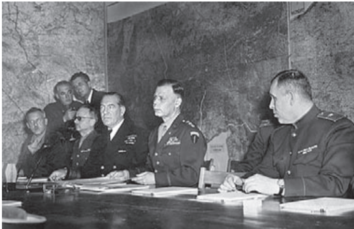
Reims. Delegacja Aliantów: generał Savez, generał Smith, generał Susłoparow

4 maja wysłany przez niego admirał Hans Georg von Friedeburg, po krótkich rozmowach z brytyjskim marszałkiem Montgomerym, podpisał kapitulację wojsk niemieckich w północno-zachodnich Niemczech, Danii i Holandii. 5 maja admirał von Friedeburg udał się do kwatery głównej Alianckich Sił Ekspedycyjnych, mieszczącej się w Reims we Francji, by tam kapitulować przed armią amerykańską. W zamysle Niemców szereg indywidualnych kapitulacji przed poszczególnymi Aliantami na Zachodzie dałby im sytuację bardzo korzystną, bo poddanie Niemiec zachodnich, przy zachowanym stanie wojny ze Związkiem Radzieckim. Teren wymieniony w kapitulacji byłby miejscem, do którego można by było ewakuować ludność cywilną uciekającą przed okrucieństwami wojsk radzieckich, a wojska niemieckie spychane wciąż przez Rosjan, tu mogłyby spokojnie składać broń. Jed-