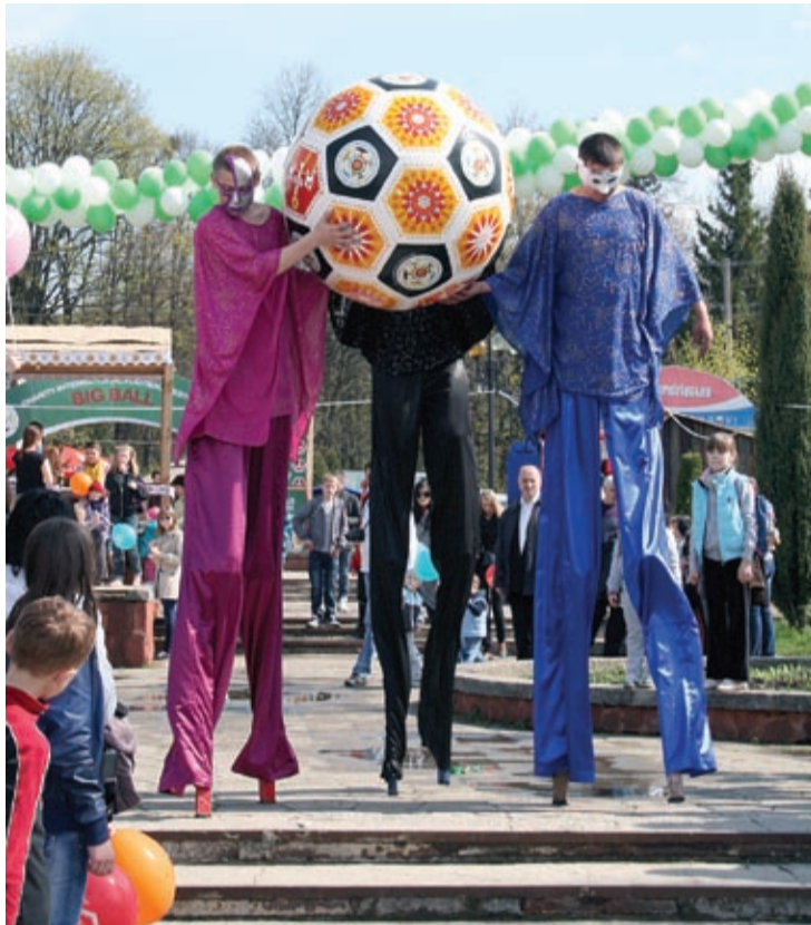
Toczą się EURO-piłki na scenę