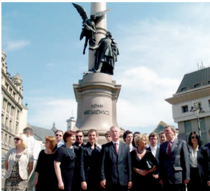
Wspólne zdjęcie uczestników uroczystości