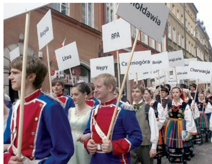
Uroczysty pochód Polonii do Pałacu Prezydenckiego

Prezydent Bronisław Komorowski, przemawiając na dziedzińcu do zgromadzonych przed Pałacem Prezydenckim powiedział, że wszyscy potrzebujemy symboli, które nas łączą i jednoczą. Takim symbolem jest właśnie biało-czerwona, polska flaga, której święto obchodzone jest od 2004 roku, właśnie 2 maja. Następnie odby-