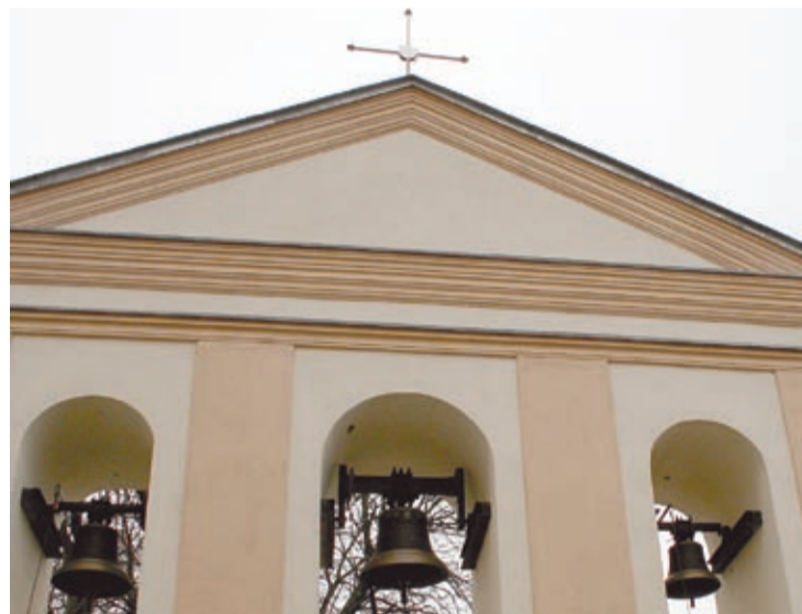
Dzwonnica z trzema dzwonami: Karolem, Karoliną i Czesławem

W 1648 roku zamek wytrzymał oblężenie kozackie, ale w 1655 roku został zdobyty przez zdradę obrońców. Po 1672 roku zamek stał się siedzibą Ibrahima Szejtana, ale już w 1684 zamek odwiedził Jan III Sobieski. Działania wojenne zniszczyły fortyfikacje, ale po modernizacji w XVIII wieku stał się główną rezydencją Lanckorońskich na Podolu.