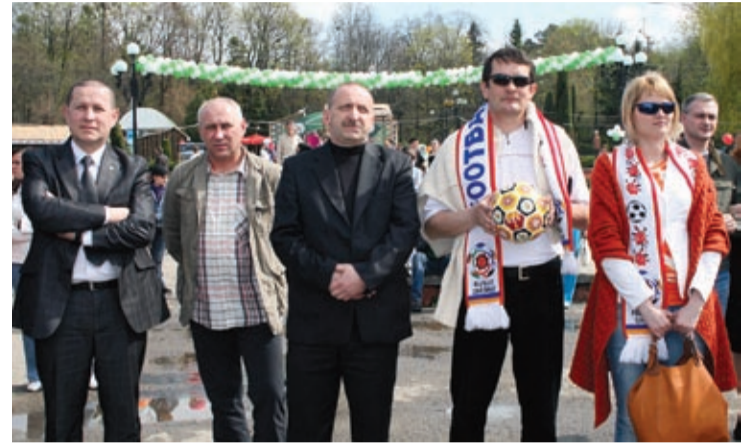
Delegacje z Prudnika i Nadwórnej

Każde ze swych dzieł mężczyzna poświęcił znanym ludziom: prezydentowi UEFA Michaelowi Platini, wybitnemu trenerowi Waleremu Ło-