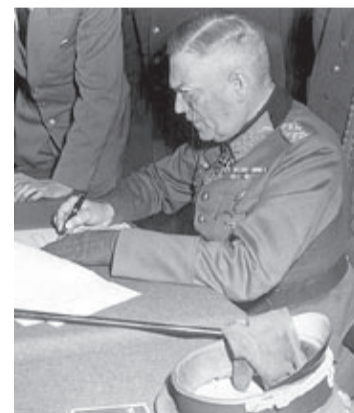
Feldmarszałek Keitel podpisuje kapitulację Niemiec

nak nie miał zgody Stalina na podpisywanie tej kapitulacji w imieniu Związku Radzieckiego. Kapitulacja Niemiec, po tylu latach okropnej wojny, odbyta na chybcika, w środku nocy, bez należytego ceremonialu, to się nie mieściło Stalinowi w głowie. Nie tak sobie Stalin wyobrażał zakończenie wojny. Toteż zażądał natychmiastowego powtórzenia ceremonii kapitulacyjnej. Tym razem w zdobytym Berlinie. Tym razem z udziałem możliwie najwyższych oficerów tak ze strony niemieckiej, jak i ze strony alianckiej. Tym razem z całą oprawą,