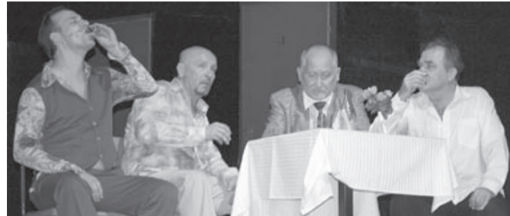
Scena z przedstawienia „Jesteśmy na wczasach, czyli polska miłość”, opartej na piosenkach Wojciecha Młynarskiego

W sztuce mowa jest o złożonych stosunkach siedmiorga ludzi – czterech mężczyzn i trzech kobiet, którzy co roku przyjeżdżają do pensjonatu „Biały Orzeł” na wypoczynek. Nie są małżeństwami, ale łączą ich stosunki intymne. Dlatego często pomiędzy nimi wynikają śmieszne i smutne sytuacje, wyrażone przez słowa piosenek. Prawdziwym rodzyńkiem spektaklu są dowcipy z okresy socjalistycznej Polski.