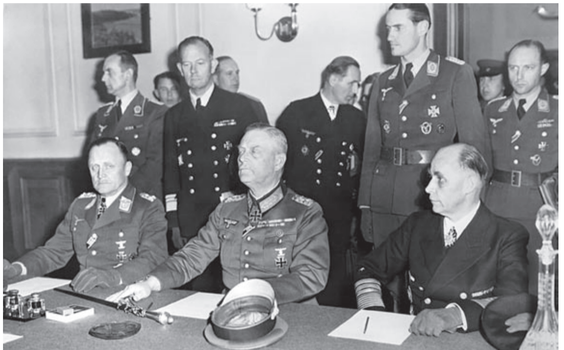
Berlin. Delegacja niemiecka. Od lewej: generał Stumpff, feldmarszałek Keitel, admirał von Friedeburg

nak nie miał zgody Stalina na podpisywanie tej kapitulacji w imieniu Związku Radzieckiego. Kapitulacja Niemiec, po tylu latach okropnej wojny, odbyta na chybcika, w środku nocy, bez należytego ceremonialu, to się nie mieściło Stalinowi w głowie. Nie tak sobie Stalin wyobrażał zakończenie wojny. Toteż zażądał natychmiastowego powtórzenia ceremonii kapitulacyjnej. Tym razem w zdobytym Berlinie. Tym razem z udziałem możliwie najwyższych oficerów tak ze strony niemieckiej, jak i ze strony alianckiej. Tym razem z całą oprawą,