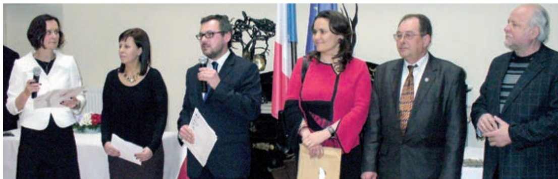
Podczas uroczystego otwarcia Francuskiej Wiosny

Wybitny francuski pisarz Honore de Balzac, jadąc do ukochanej Eweliny Hańskiej ponad 160 lat temu, zatrzymał się na nocleg w hotelu George we Lwowie. Obecnie na tym miejscu stoi hotel o tej samej nazwie, a stolica Galicji nadal ma satysfakcję z tego wydarzenia. Z okazji wspomnienia słynnego humanisty XIX wieku, właśnie tam 18 kwietnia br. odbyło się uroczyste otwarcie Francuskiej Wiosny.