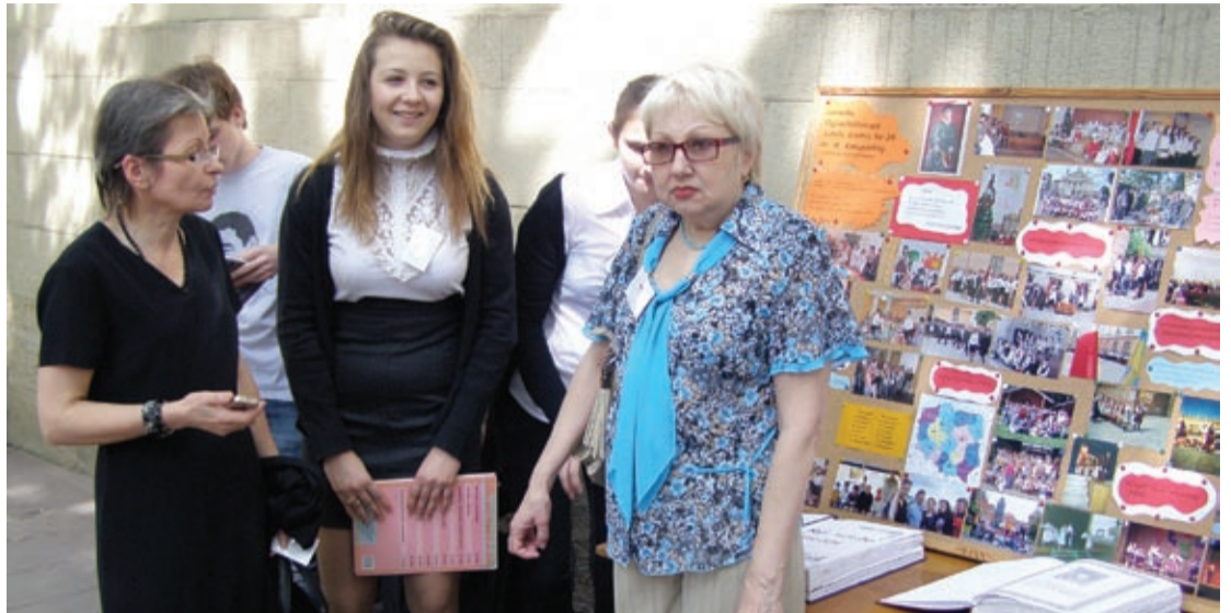
Prezentacja szkoły nr 24

Pod taką nazwą w dniu 11 maja br. została zorganizowana przez władze lwowskie pierwsza tego rodzaju impreza-maraton. Pod frontową ścianą ratusza, w cieniu kwitnących kasztanów, 28 lwowskich szkół, które prowadzą nauczanie w językach obcych, demonstrowało swoje osiągnięcia.